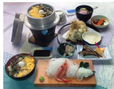
★山菜釜飯 やまなみ ¥1500