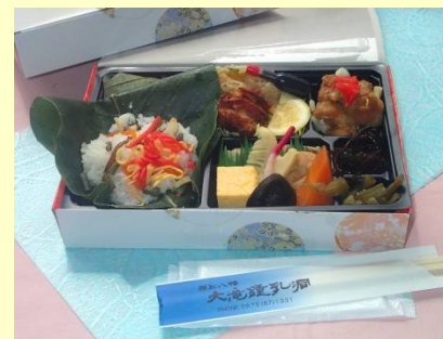
★朴葉すし弁当 ¥1000 茶付