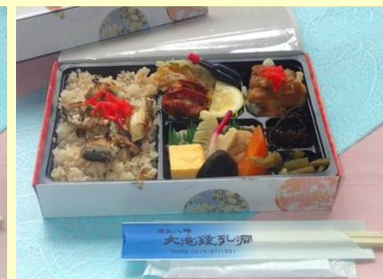
★鮎めし弁当 ¥1000 茶付