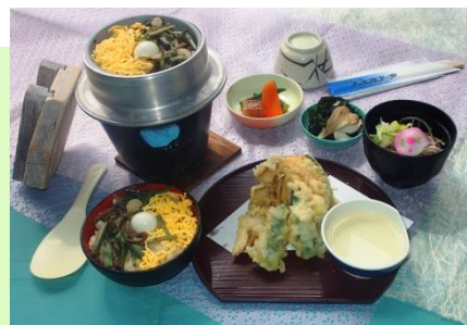
★山菜釜飯 こもれば ¥1000