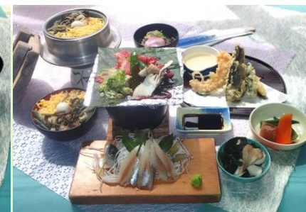
★牛肉の朴葉焼き膳 ¥2000