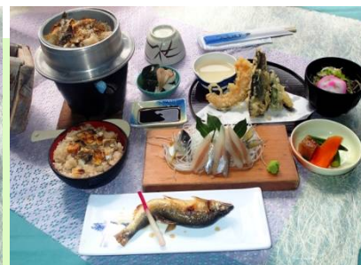
★郡上の鮎めし鮎さし ¥1700