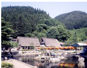
★合掌造りと食事会場