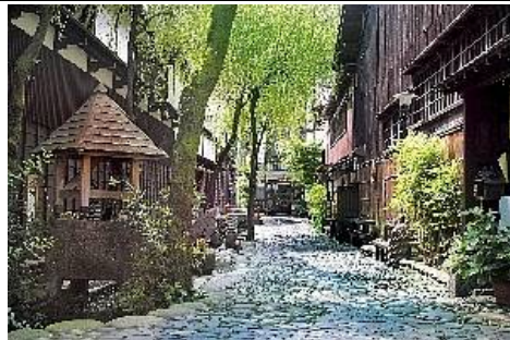
郡上八幡の町並み