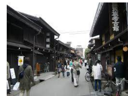
飛騨高山古い町並み