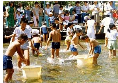
魚のつかみ取り(焼いて食べます)