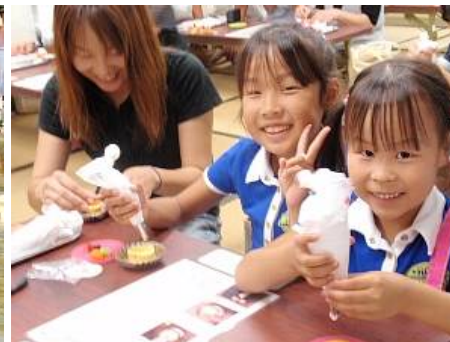
フルーツタルト作り(さんぷる工房)