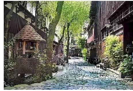
郡上八幡町並み/やなかの小径