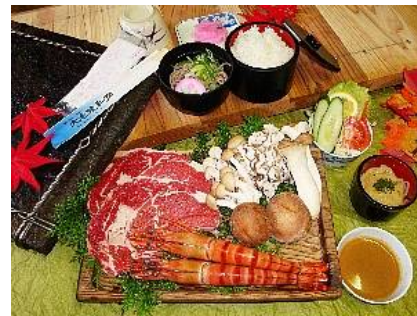
古代焼き石焼き料理