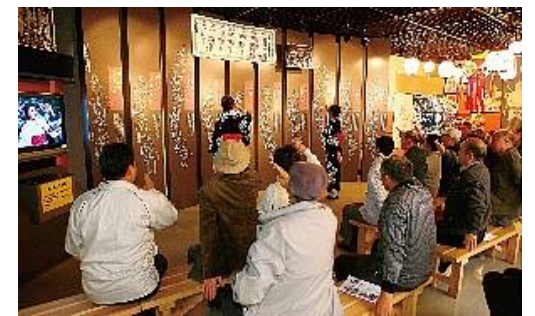
郡上八幡博覧館の踊り体験